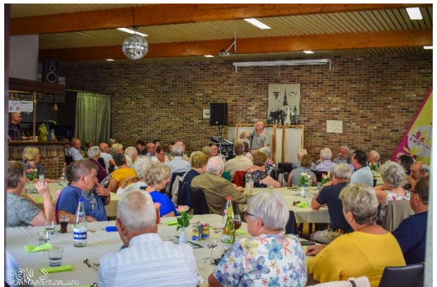
Andere foto's Lunner Website KWB