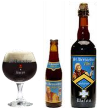
St Bernardus Abt 12

Dit bier kan beschouwd worden als de absolute topper in de hiërarchie van de St. Bernardusbieren en is tevens het bier met het hoogste alcoholpercentage (10% alc.vol).